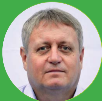
Mgr. Jiří Pospíšil, ODS