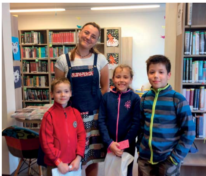
Předávání odměn ze šifrovačky