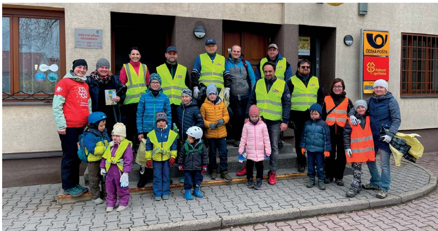
Uklidíme Česko