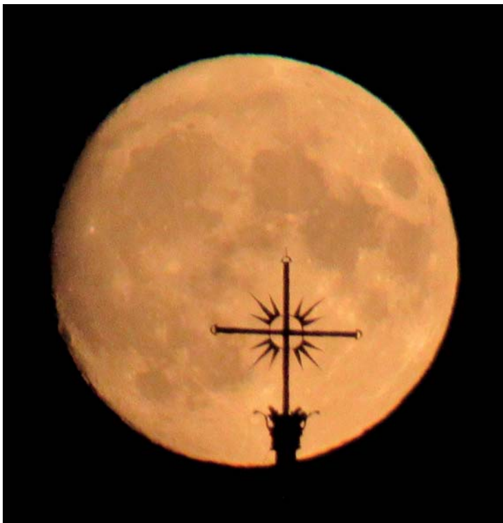
Kříž věže farního kostela, na pozadí měsíc.

Milí farníci a všichni spoluobčané a přátelé farnosti Troubska, začátek letošního podzimu je velmi poznamenán volební atmosférou. Je to období naděje, že volby přinesou něco nového, čerstvého a především lepšího, protože to je smysl každé naděje. Neseme si v sobě ještě důležité naděje, které s volbami jaksi nesouvisí. Je v nás touha po ukončení války v naší blízkosti. Snad to není touha jen sobecká,