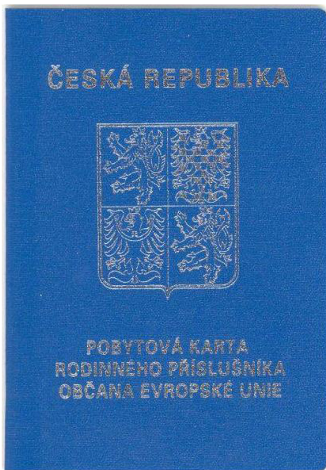
Přední strana dokladu (tmavě modrý doklad ve formě knížky, stříbrný tisk na přední straně)