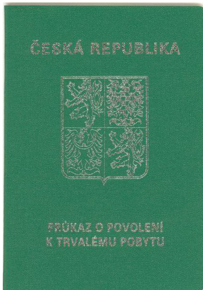
Přední strana dokladu (tmavě zelený doklad ve formě knížky, stříbrný tisk na přední straně)

Doklad o povolení k trvalému pobytu rodinného příslušníka občana EU a (od 1. 1. 2018) vydáván také jako doklad o povolení k trvalému pobytu občanů EU a také občanů Islandu, Lichtenštejska, Norska a Švýcarska a jejich rodinným příslušníkům.